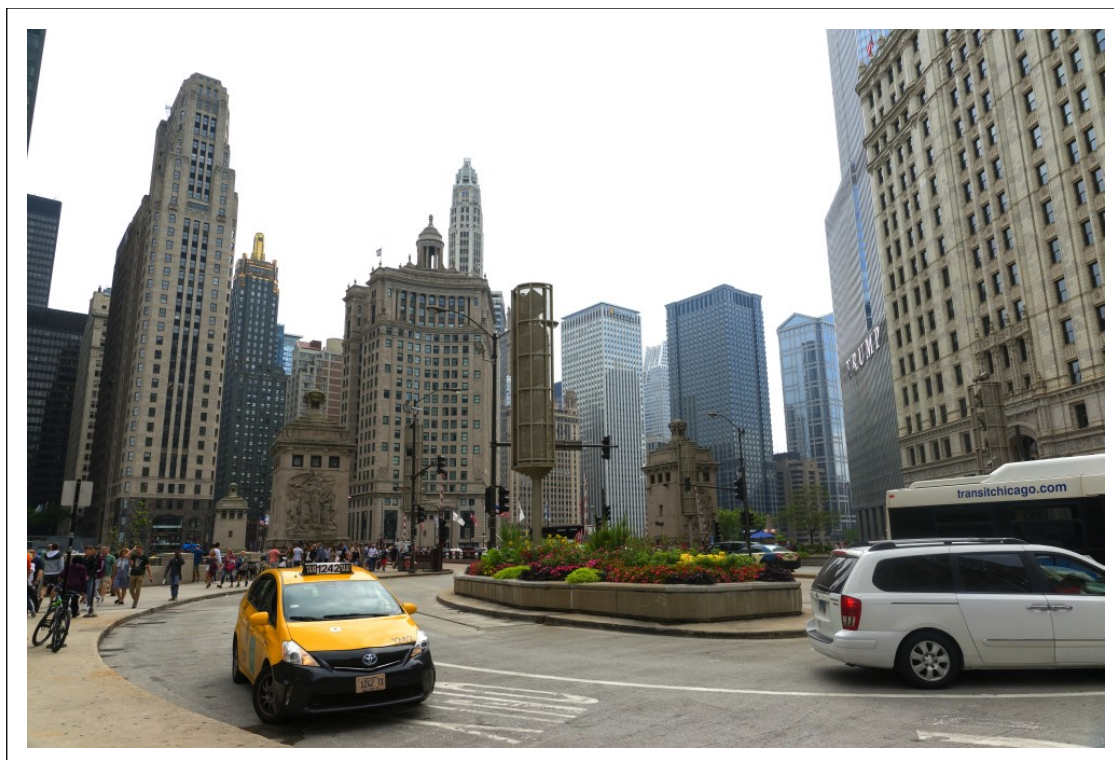
Opera di Ezio Venturi e Janina Rabottini, tratta da "U.S.A. 2018" (Ven. 24)

"Le mie sono fotografie che potrebbero fare tutti. Io sono un uomo qualunque che va in giro e fissa il riflesso dello spettacolo della strada".