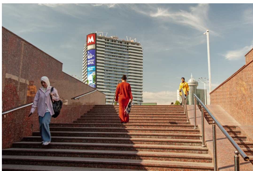
Opera di Paolo Boschi e Barbara Pozzone tratta da "Mangystau e Uzbekistan" (Ven. 29)

"La luce infuocata e la potenza del colore sembravano in qualche modo impressi nelle culture con cui stavo lavorando; era un altro pianeta rispetto alla riseruatezza grigio-marrone del New England, nella quale ero cresciuto. Da allora ho lavorato quasi esclusivamente con il colore".