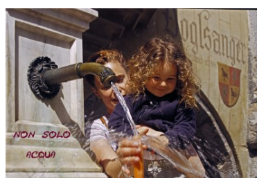
Opera di Viviana Masotti