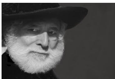
Opera di Viviana Masotti