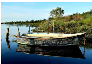
Opera di Laura Branzanti