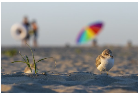
Opere di Davide Aresti (Ven. 17)